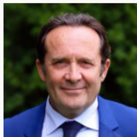
Pierre BEDIER • Représentant du Conseil Départemental des Yvelines